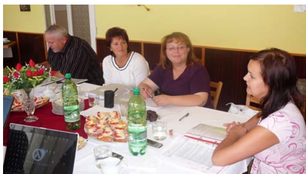
Zo spoločných rokovaní s partnerskou obcou Trizs

S účinnosťou od 1.7.2009 vstúpil do platnosti zákon NR SR č.258/2009 Z.z., ktorým sa mení a dopĺňa z. SNR č.138/1991 Zb. o majetku obcí, podľa ktorého prevody vlastníctva majetku obcí (t.j. predaj) sa musia vykonať len na základe obchodnej verejnej súťaže, dobrovoľnou dražbou, alebo priamym predajom za cenu vo výške všeobecnej hodnoty majetku stanovenej podľa osobitného predpisu. V praxi to znamená, že priamym predajom možno predaj napr. obecný pozemok len vtedy, ak bude predložený súdnoznalecký posudok, ktorý určí hodnotu predávaného pozemku. Obecné zastupiteľstvo môže pozemok predaj minimálne za cenu určenú posudkom alebo za vyššiu cenu. Posudok dá spracovať ten, kto má záujem o kúpu majetku obce.