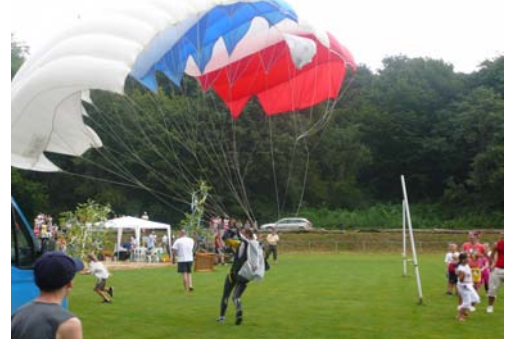
Stretnutie Pod Balkom a Ružínsky festival